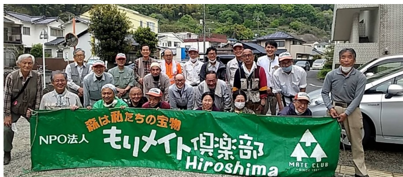
3年前(2022年4月)の集合写真。ほっとひと息、作業を終えほころぶ笑顔。

もりメイト倶楽部は2008年から地元の要請を受けて整備に入っており、近隣の竹害防止活動の取り組みと併せ例会として取り組んでいます。3年ぶりのヤマザクラ、きっと我われを待っていることでしょう。