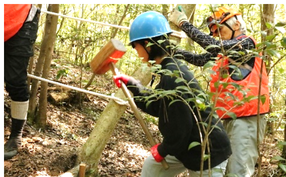
杭を打つのは力があるなあ。「せ〜の、よいしょ！」