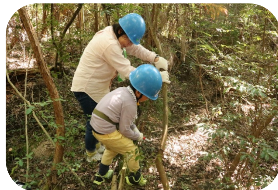
もりの中の木を伐って歩けるようにしたよ。