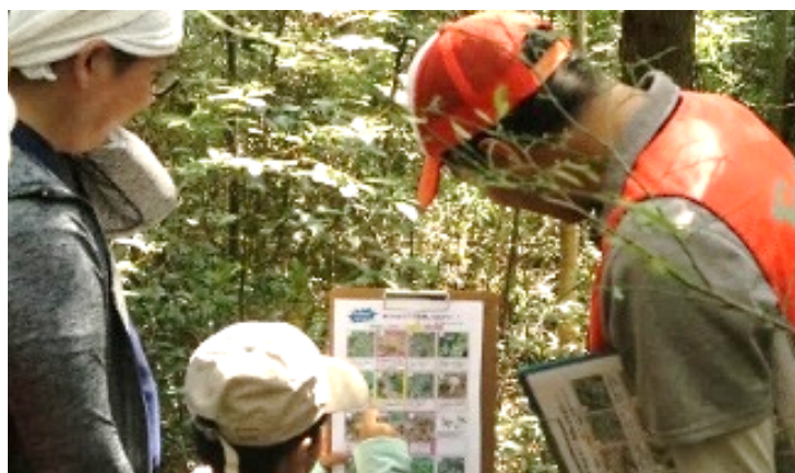
ビンゴをしたよ。いろんな形の葉っぱを見つけたよ。